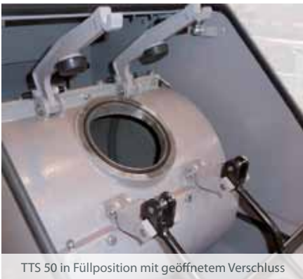
TTS 50 in Füllposition mit geöffnetem Verschluss

Eine Positionierung der Mahltrommeln in die Befüll- bzw. Entleerungsstellung, erfolgt im Tippbetrieb oder über eine optionale Steuerung mit automatischer Positionierung.