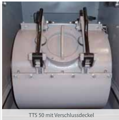
TTS 50 mit Verschlussdeckel