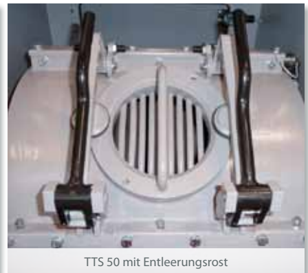
TTS 50 mit Entleerungsrost