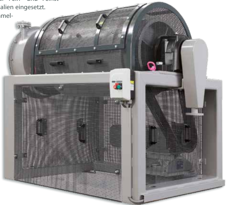
kontinuierliche TNS 200 K

Die Trommelmühlen werden zur Fein- und Feinstzerkleinerung von spröden Materialien eingesetzt. Diskontinuierlich betriebene Trommelmühlen ermöglichen neben der Zerkleinerung auch eine Homogenisierung des Mahlgutes.